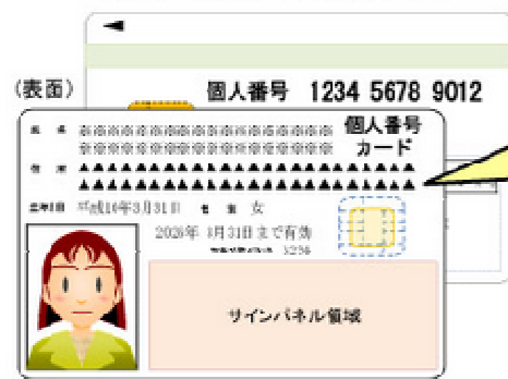
(表面) 個人番号カードの様式(案)

個人番号カードの券面には、「氏名」、「住所」、「生年月日」、「性別」、「個人番号」等が記載され、「本人の写真」が表示され、かつ、これらの事項等がICチップに記録される。(第2条第7項)